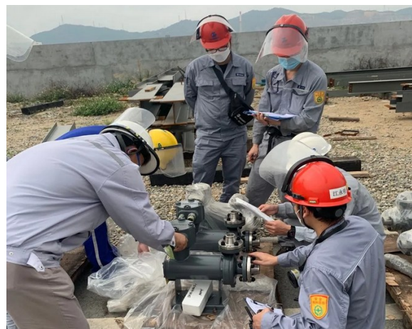
△第一安装公司检查到货设备情况