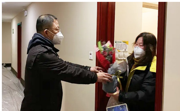
△三八妇女节当天，宁波分公司为复工女员工送花