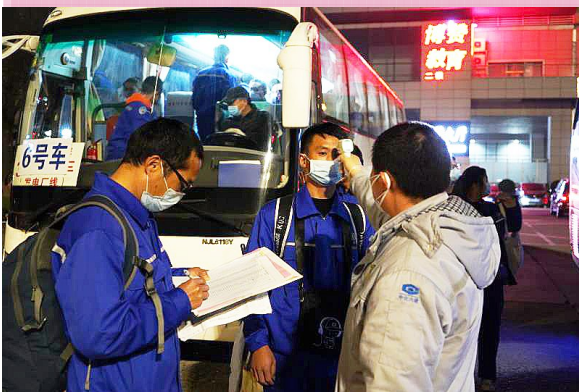
△宁波分公司防疫应急接驳大巴接“襄阳-烟台”高铁复工专列各分公司职工

自新型冠状病毒肺炎疫情发生以来，中国化学工程第六建设有限公司所属各单位按照党中央、国务院、集团公司及公司的要求，一手研究部署疫情防控工作，一手结合多种形式保障企业复工复产，在做到防控不松劲、疫情不反弹的前提下，精准稳妥推进复工复产工作。