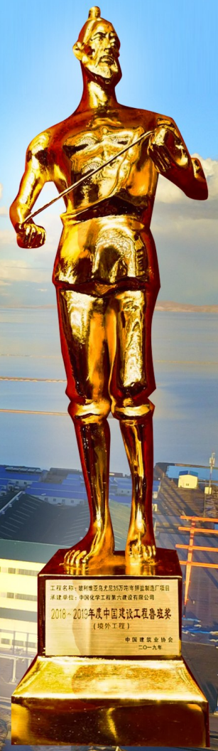
工程名称：玻利维亚乌尤尼35万吨钾盐制造厂项目 承建单位：中国化学工程第六建设有限公司 2018-2019年度中国建设工程鲁班奖 (国外工程) 中国建筑业协会 2019.9.18