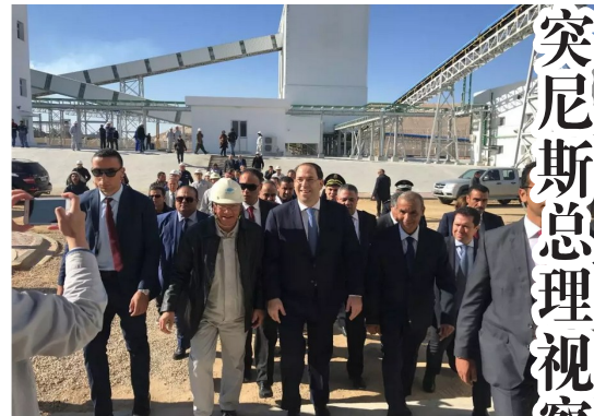
突尼斯总理视察六化建重磷酸钙项目

此次再夺鲁班奖(境外工程)，是六化建积极融入国家“一带一路”发展战略，践行中国化学工程中长期发展战略，深化自身品牌工程建设以来的又一重磅成果，充分说明六化建对海外工程重视程度在不断提高，品牌影响力也得到了大幅提升。(下转三版)