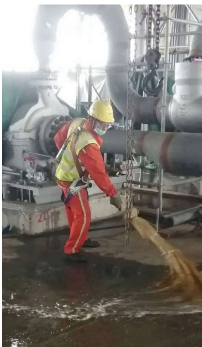
频繁降雨，六化建第三分公司内蒙久泰项目部扫水忙 （通讯员 张筱雯）