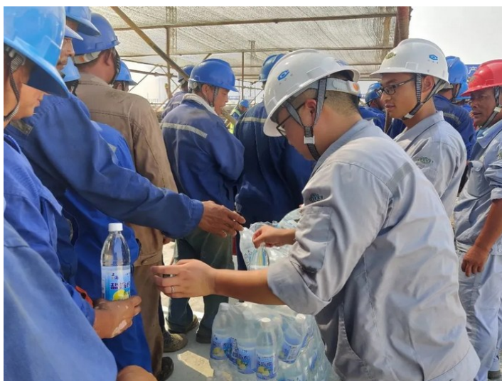
六化建北京分公司连云港盛虹炼化气化项目部为工人送去含盐饮品等解暑降温慰问品 （通讯员 朱炳晓）