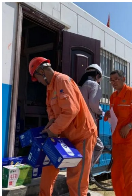
六化建宁波分公司为大干工人送上酸奶等物资，保障工人师傅体力（通讯员 陈亮）