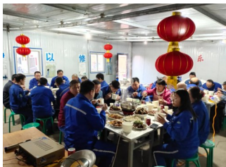
第五分公司留守职工年夜饭