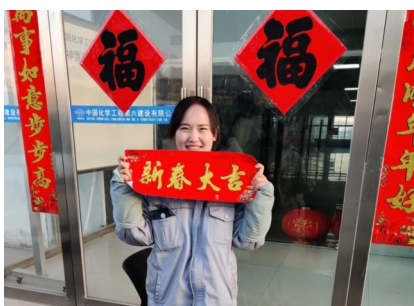
青海中复神鹰项目留守职工贴春联