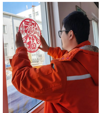
宁波分公司留守职工贴福