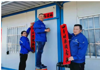
第三安装公司留守职工贴春联